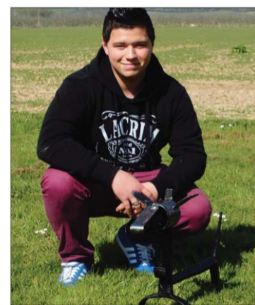
Quatre heures ont été nécessaires pour finaliser les œuvres.

L'exposition sera ouverte au public de 9 heures à 17 heures, et les sculptures pourront également être achetées par le public, précisent les responsables de la structure livradaise. C. C.