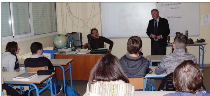
Le président est venu remettre un chèque pour les frais de séjour.

Chaque année, la Fédération nationale André Maginot soutient des collégiens qui veulent partir sur les traces de leur histoire. C'est le cas cette année pour des élèves du collège Gaston-Carrère. Ils se sont rendus à Verdun, lors d'un voyage scolaire, en mars, pour mieux comprendre la Grande Guerre. Un voyage auquel la Fondation nationale André Maginot a participé. Jeudi, le président départemental de la fondation est venu remettre un chèque de 2 000 euros au collège, pour participer aux frais financiers de l'établissement qui avait organisé le séjour.