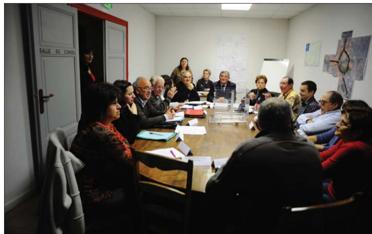
Vendredi soir, lors de l'élection du maire et des adjoints.