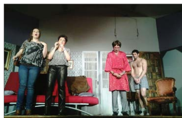
Les Zygotonyc's. PHOTO SO